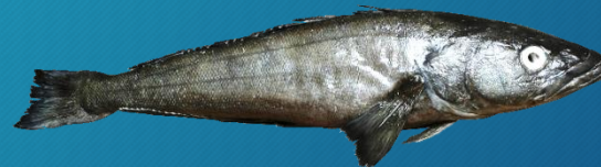
银鳕鱼 ( Dissostichus eleginoides )