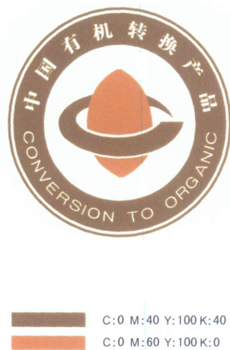
图 2 中国有机转换产品认证标志